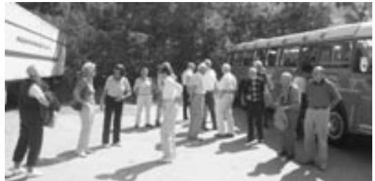
Ved Modalen og Eksingedalen billag sitt anlegg på Eidslandet, ble veteranbuss som er under restaurering beskuet. Dette er en Bedford 1953 mod. med et karosseri som sies å være bygget hos Auto 1923.