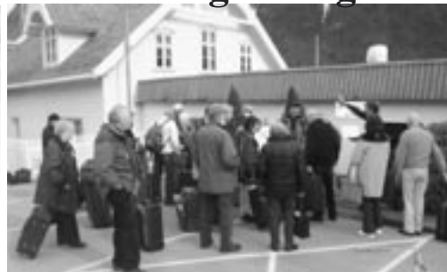
Hjertelig velkomst av hotellsjefen