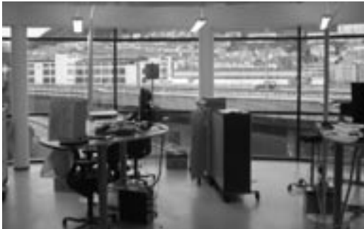
Besøk HSD (Tide's) administrasjon side 5