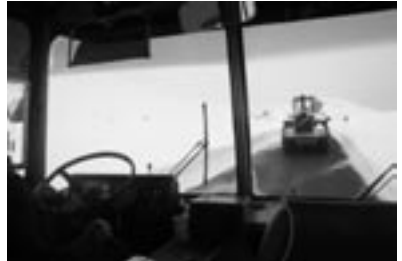
Vikafjellet til Sogndal og Veitastrand