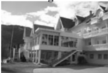
Hofslund hotell i Sogndal