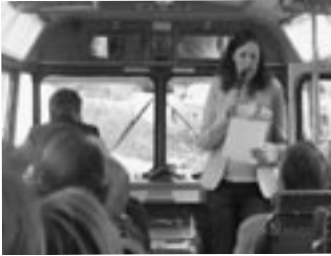
Reiselivlaget i Knarvik informerte om Nordhordland