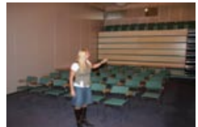
Cruise til Danmark side 11