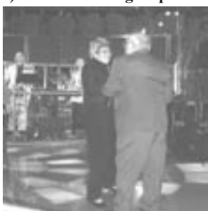
Danseløven på plass