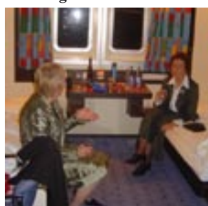
Nei til sjøsyke