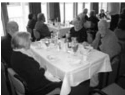
Frokost og bufe