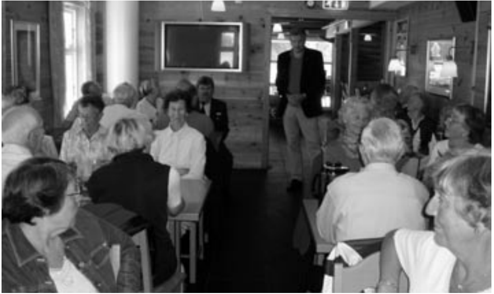
Ordfører i Modalen informerte for serveringen om en liten kommune i stor medgang.