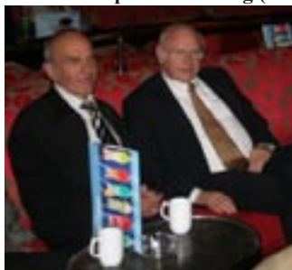
Gutta - Boys på tur

58 personer var med på turen 6-8 desember 2006 som presenterte seg (bildet) med fremføring av positivt aktuelt og tilbakeblikk.