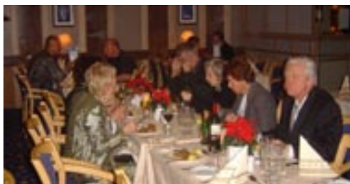
Synd med all maten man ikke har mage til