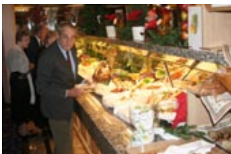
Med alle sorter dessert mm