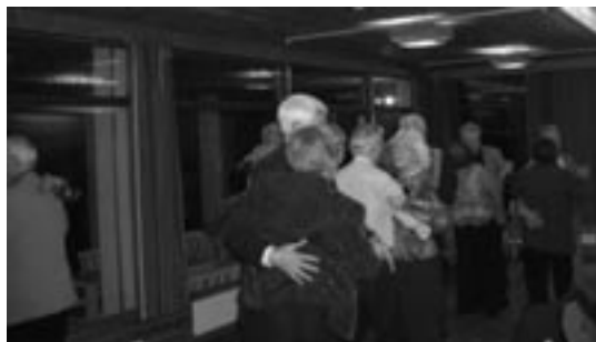
Vi trimmet i egen hall