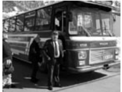
Gullmerke for innsats side 2