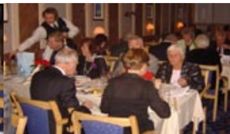
Kos og hygge.