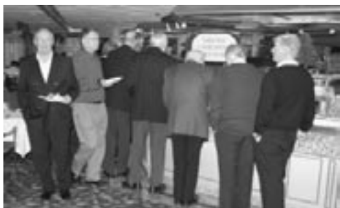
Ingen køer - et fantastisk julebord