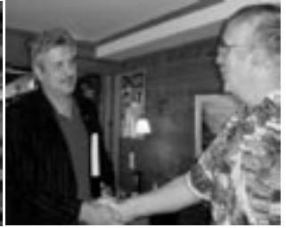
Ordfører Mo fikk veteranboken 450 sider Tilbakeblikk.