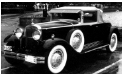
Nash 891 2d cabriolet 1931 eier Ymer Sletten