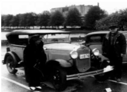
Ford A Pheaton 1930 eier Reidar Ljung (fra Sauda)