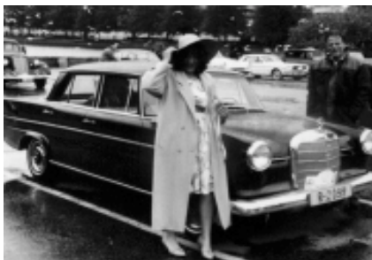
Mercedes Benz 190 1962 eier Rolf Tofting