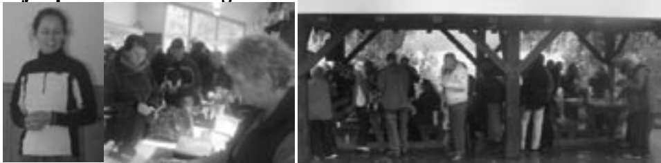
Kaffe på Landbruksskolen Aurland - Gardsbutikk - Pizza på Voss