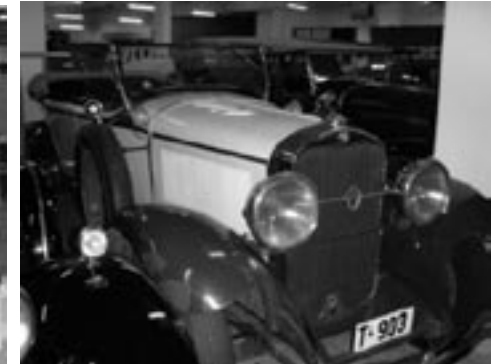
Studebaker President 1930