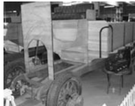
1900 UNIC lastebil under restaurering

Rundt mange av bilene var dessuten skapt et tidsriktig miljø.