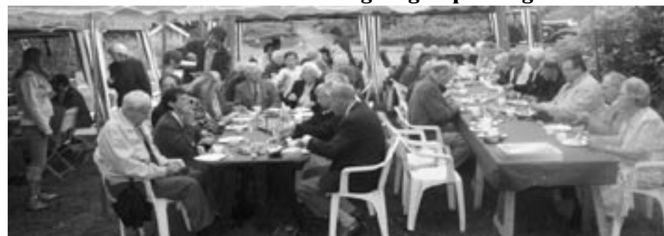
Arrangement for 80 personer med gullmrk og spesielt inviterte