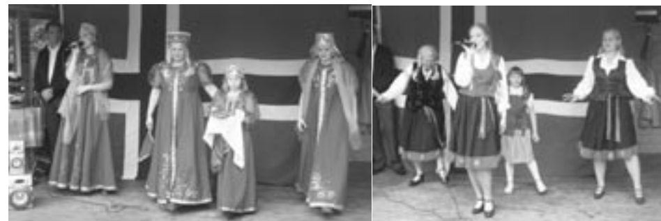
Russisk Baltic Akademi fra Riga laget spesielt gullshow