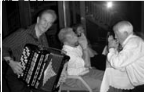
Tur over Vikafjellet til opphold 2 netter Hofslund Hotel i Sogndal