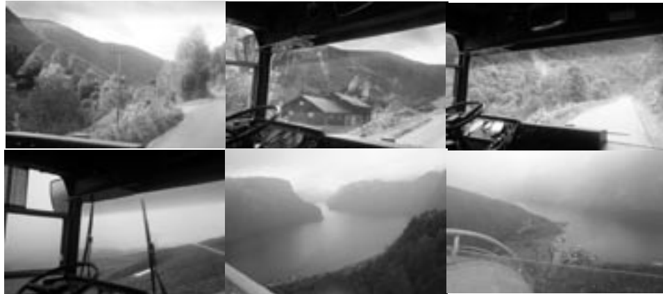
Kjempeflott tur mot Bergen med veteranbussen over Aurflandsfjellet