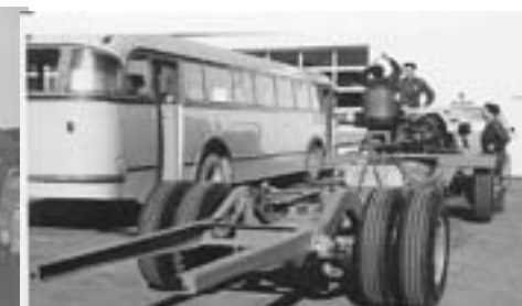
Ombygging og forbedring av Volvo R1227