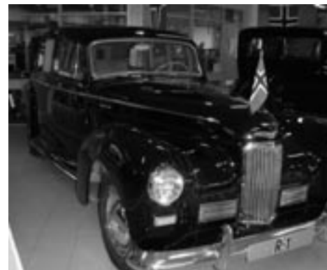
R-1 Kongebilen i Bergen