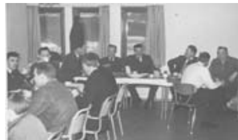
Julefeiring 1960 årene