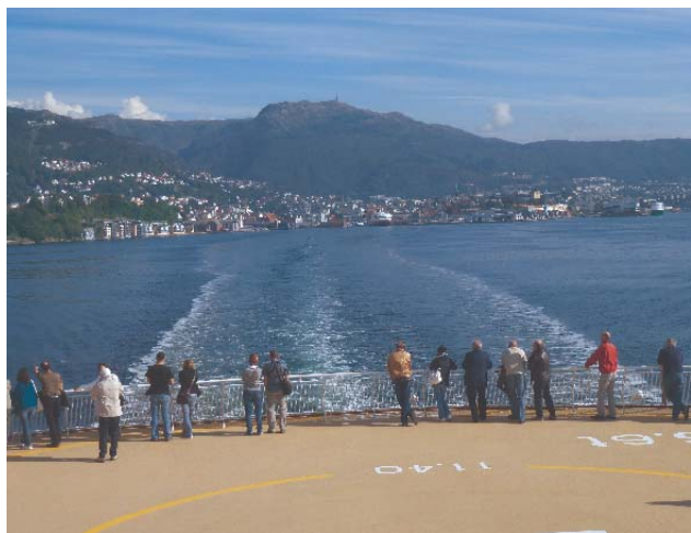
Veteraner på reise med Fjordlines Stavangerfjord til Danmark