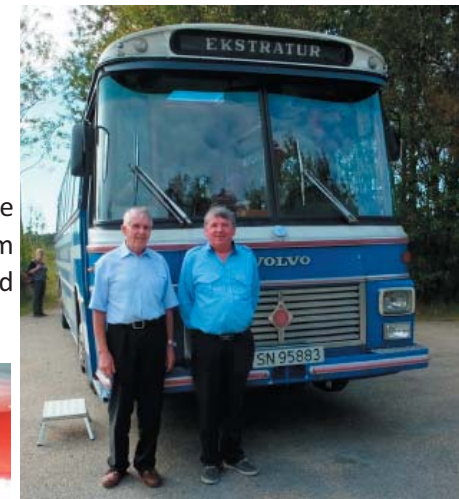
Reiseleder og sjåfør