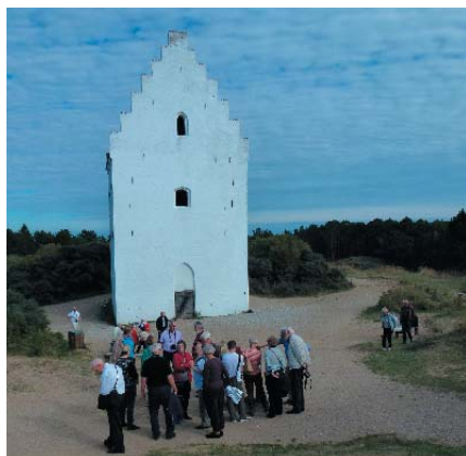
Den Tilsandede Kirke

De eldste opplysninger om kirken er fra 1387 hvorkirken omtales i forbindelse med en rettsak om en skipslast kostbare klær som ble oppbevart på kirkens loft.