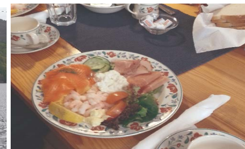
Vertskapet på Lysøen ønsket oss velkommen med båttransport og oppvartet oss med et herlig servering og foredrag om Ole Bulls liv og virke i tillegg til omvisning i huset og orientering om dette.