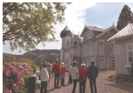
Blåturens endelige mål Lysøen, Ole Bulls hjem.