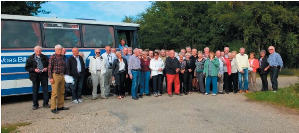
Bussgruppen Grubbildet er tatt på parkeringsplassen