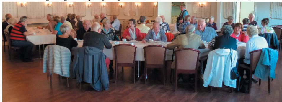
Herlig Morgenmad på Hjøring

Vi inviterer til Årets tur med Fjordlines STAVANGERFJORD onsdag 10. september, senest 1330 på hurtigruteterminalen Nøstet 1 time før avgang kl 1430. Vi møtes senere ombord kl 1900 til en overdådig buffet i Commander Buffet der du velger blant spesialiteter fra havet, gården og grønnsakmarkedet. Torsdag morgen kl 0700 ankommer båten Hirtshals og bussen kjører ildand med eget program 1 dag. Båten er tilbake til Hirtshals fra Langesund kl 1900 med avgang til Bergen kl 2100. Fredag 12. sept serveres frokost i før ankomst Bergen kl 1315. Priser kr 1300,- p.person i invendig dobbeltlugar. Tillegg kr 150 p.person utvendig lugar. Kr 1700,- inv. enkel lugar Tillegg kr 200 for utvendig enkel lugar. Inkludert Commander Buffet - en overdådig buffet og frokost fredag. For MiniLux - DeLux -Suite - be om tilbud.