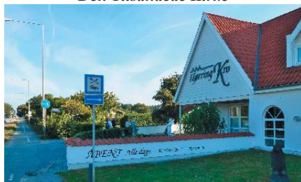
Vertshus Apen alle dager