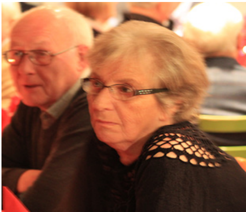
Ostring og ektefellen