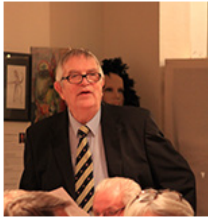
Deltok på juletreffet m/slips