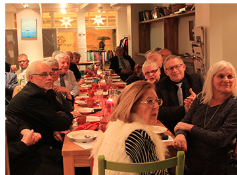
Juletallerken Magdalena side 6