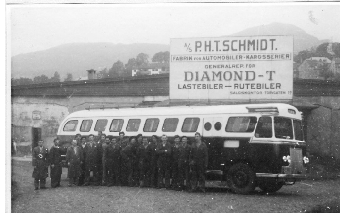
1950. Ny buss framfor fabrikk i Kiellands gt. (potetkjelleren)