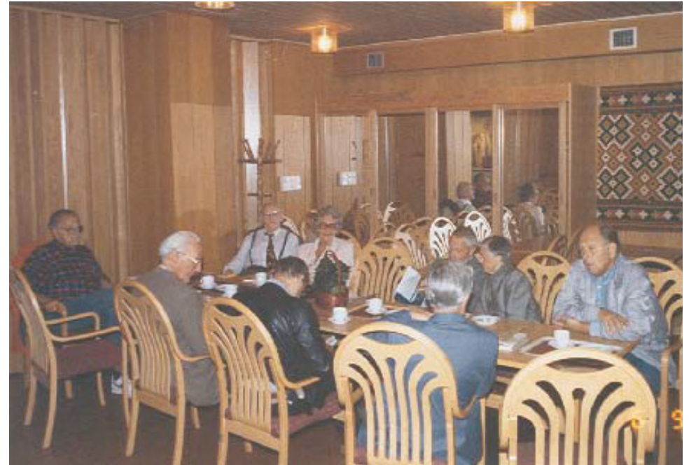
1993: Månedstreff i kafe Ervingen