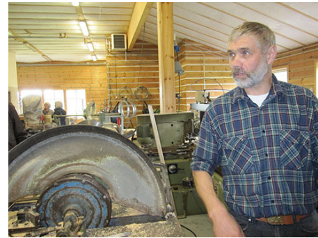
Sjefen har kontroll