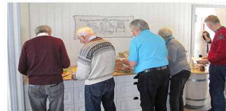
Lykkes med god servering fra Bufo