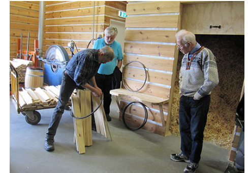
Første steg: Stavene samles inni tønnebåndet