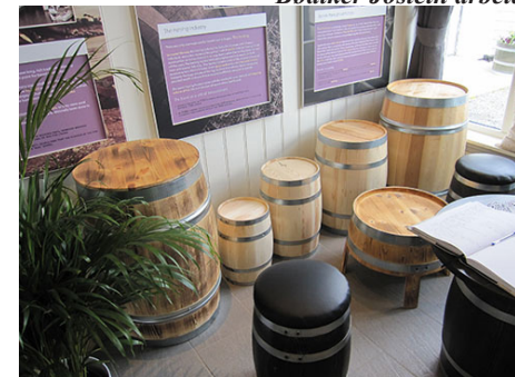
Ferdige produkt i forskjellige størrelser