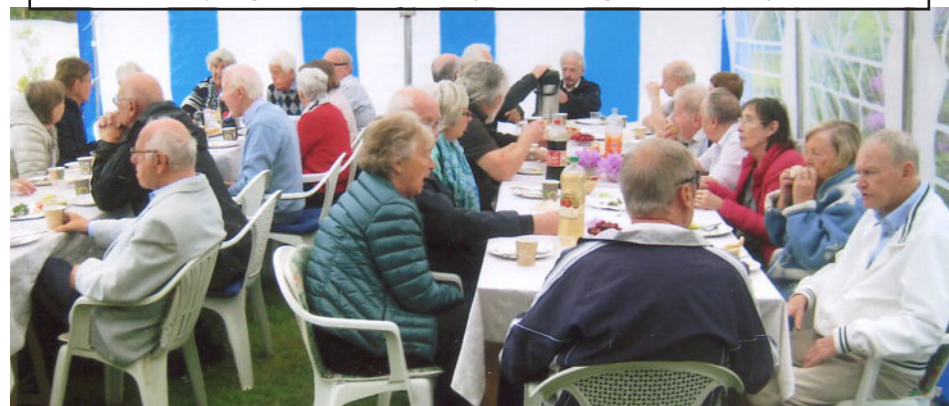
Enkel servering: Snitter, kringle, moreller, kaffe og mineralvann