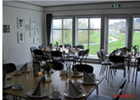
Kafe og selskapslokaler på Tønnegården