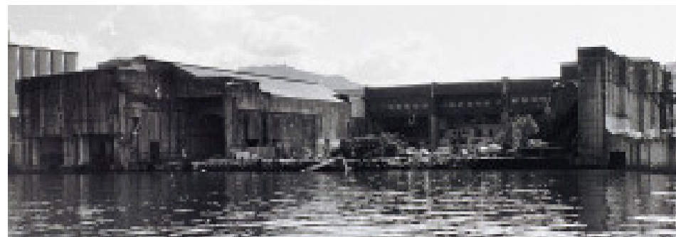
Internett