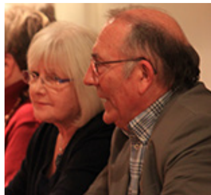
Gleden er stor når de deltar....