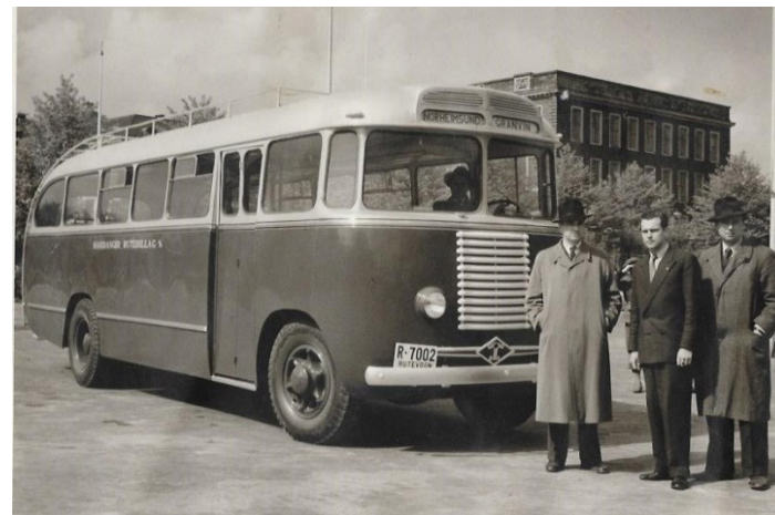
1947. Per Hammerich første overlevering ?