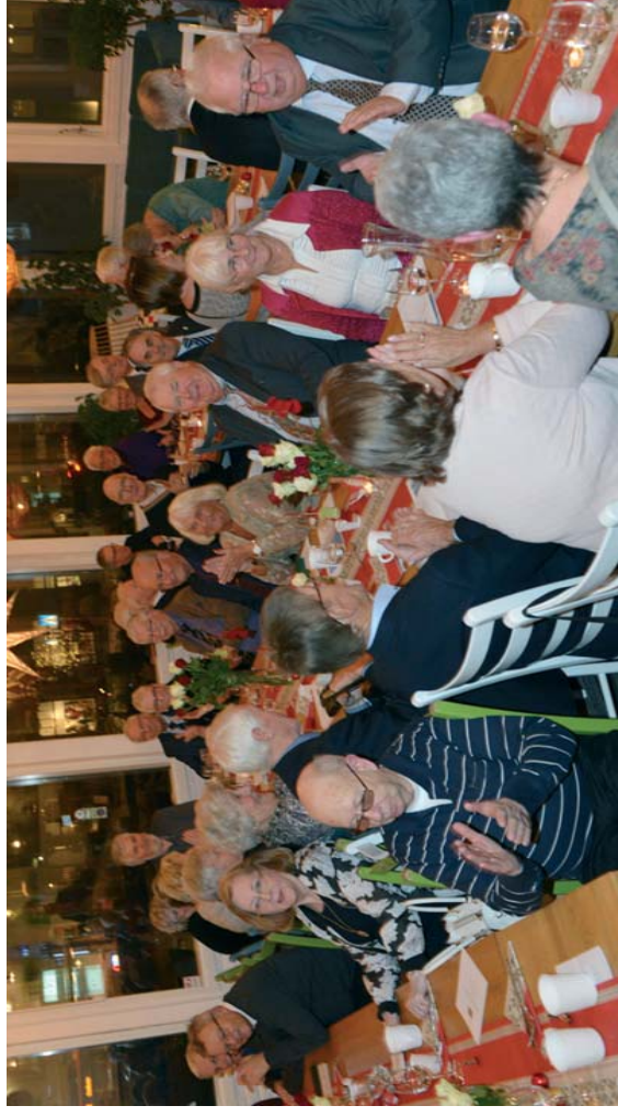
70 personer deltok