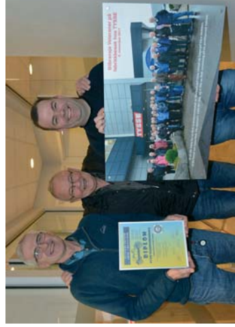
Bildegaven fra Bilbransjen Veteraner