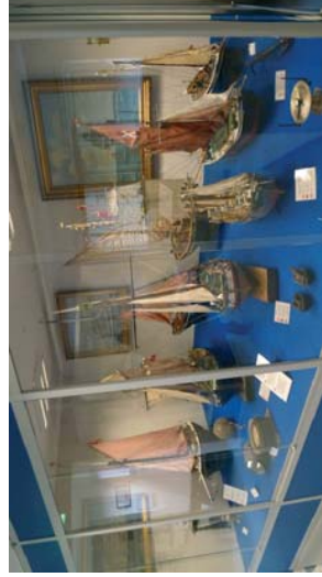
Samling som viser en stor jobb