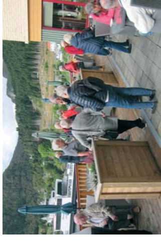
Pause solskinn etter lunsjen