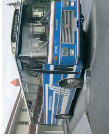
Veteranbuss som innfrir