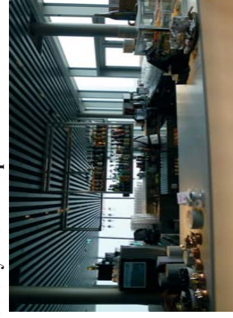
Visitt på fjellet Hoven 1011 meter over havet i Restaurant for 400 personer med alle rettigheter