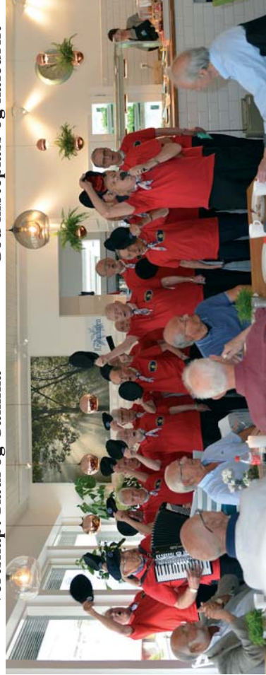
Bergens shantikor “Cap Horn” underholder med 1/2 time’s øvelse