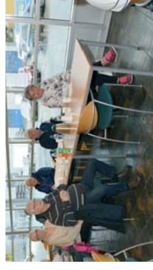
snitter og kaffe