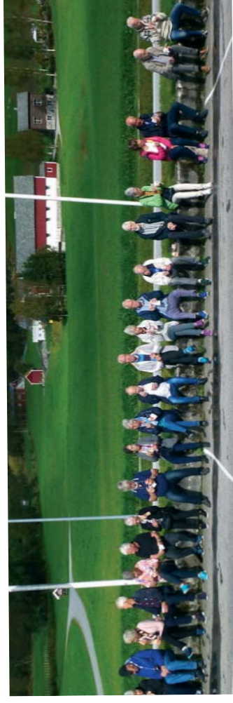
Jølstratunet: Vellykket da alle fikk softis