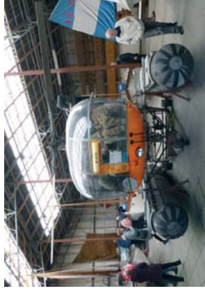
Helikopter på museum