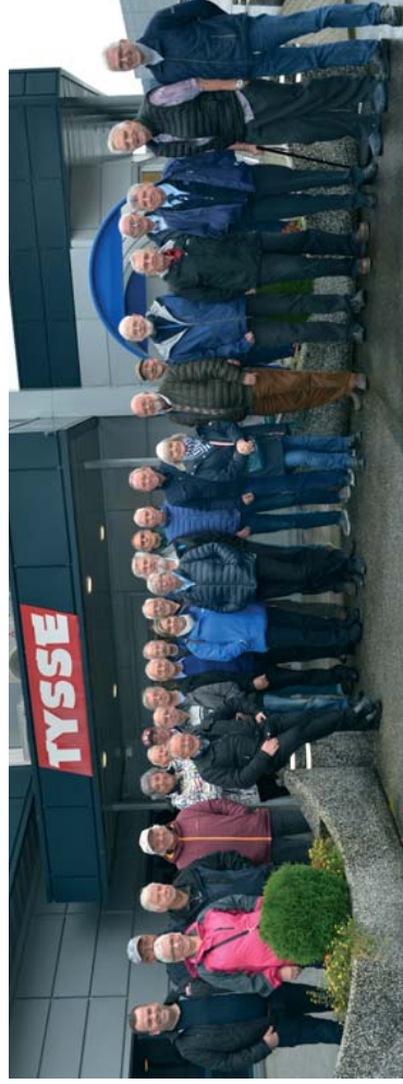
Alle samlet før omvisning på fabrikkens