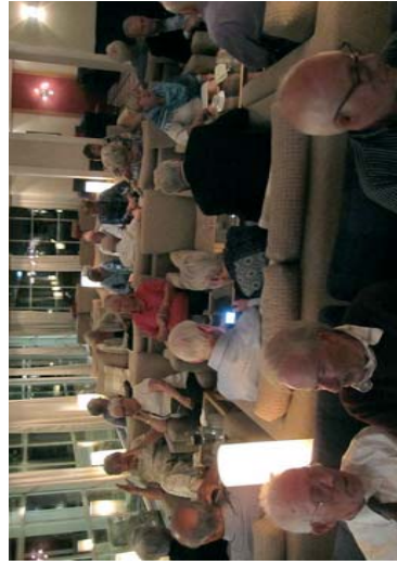
Kos og Hygge