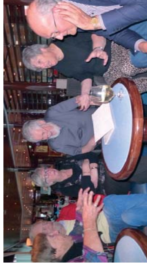
Pensjonister gleder seg med lunsj pause