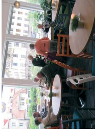
God møteplass og kafedrift