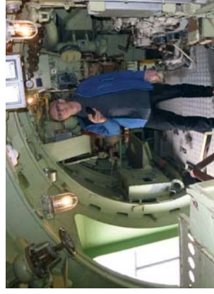
besøk i ubåt