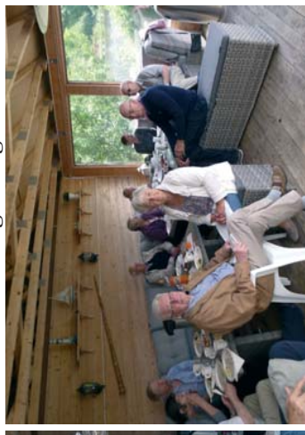
Bedre under tak da solen varmet