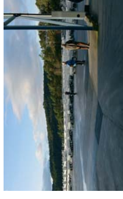
stort lager ferdige tilhengere