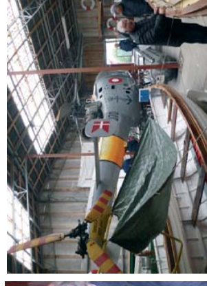
Museum med plass