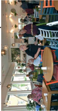
Velkommen til åpent veteran treff fra kl 1100 hver første onsdag i ny måned.