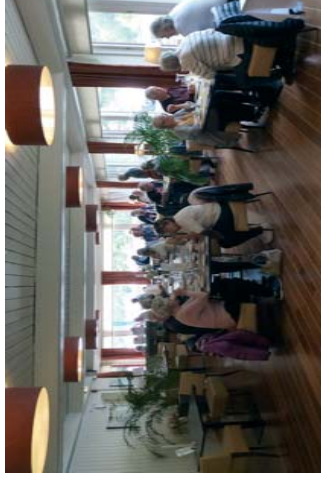
Lunsj / bufet Lavik Fjordhotell