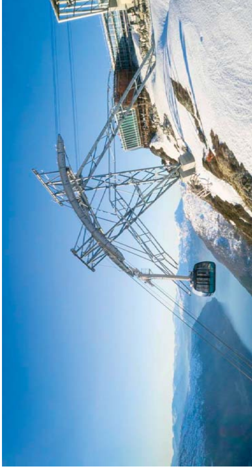
20. mai 2017 åpnet Loen Skylift - en spektakulær ny attraksjon og opplevingsarena, innerst i Nordfjord. En pendelbane løfter deg fra fjorden til 1011 m. Her nyter du utsikten over fjordlandskapet - fra restaurantbordet, eller ute på tur i fjellet.