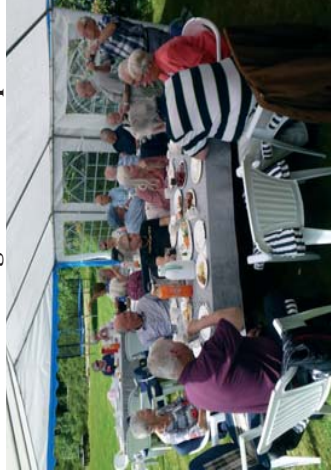
Servering kaffe, snitter og kringler