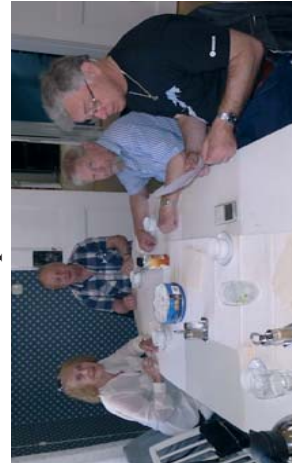
Flere rom for møter i kulturhuset