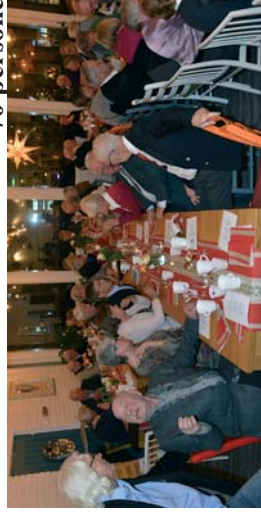
Flere møttes igjen etter mange år