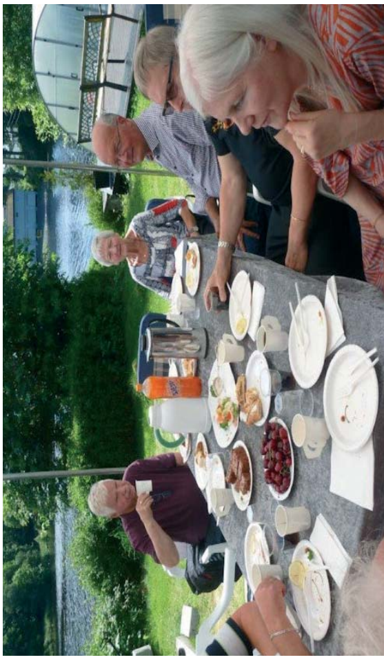
Høydepunkt møtes ute når det er sommerdag i Bergen