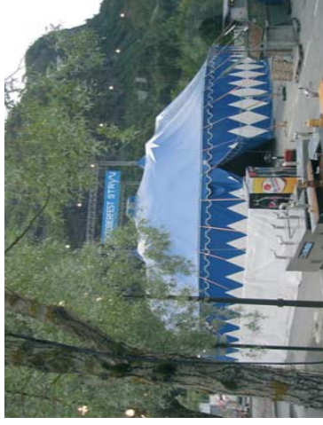
Foberedelse i Stryn til årets høstfest