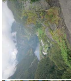
Geiranger: Butikker, natur og bakeri gleder de mange turister