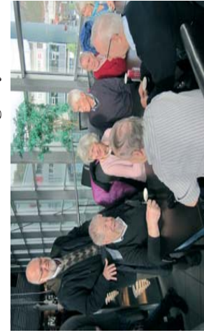
Mange savner Crystal i Fyllingsdalen