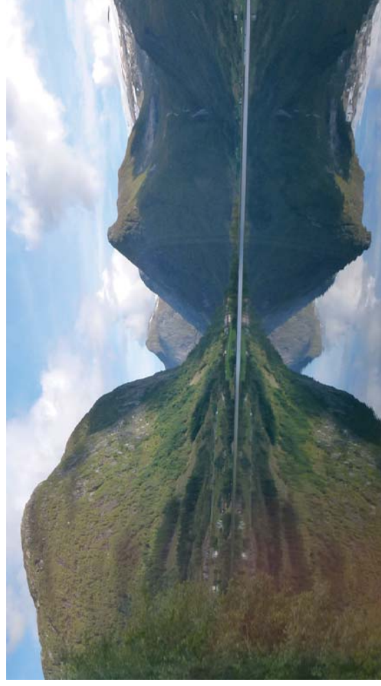
Bildet av Jølstervannet tatt fra bussen i fart