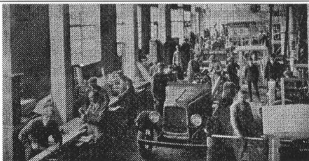
P. H. T. SCHMIDT A/S Interiør fra monteringshallen