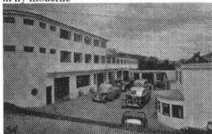
fabrikk i Fjøsangerveien 70 a.