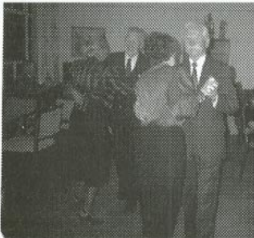
Veteraner svinger seg i dansen på Reperbanen