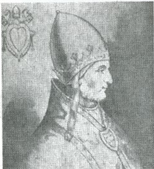
"KUNNSKAP ER MAKT!" Katedralskolens grunnlegger i året 1153, kardinal Nicolaus Brekespear, ble i 1154 valgt til pave under navnet Hadrian IV.

Det var fra året 1030, da Olav den Hellige falt på Stiklestad, kirken for første gang fikk fast fot i Norge, da under erkebispesetet i Hamburg-Bremen. Opprettelsen av den norske erkebispesetet i 1152, da keiser Konrad III døde og Fredrik Barbarosse ble hans etterfølger, var et ledd i pavestolens kamp mot den tyske keisermakt. Det var den katolske kardinal Nicolaus Brekespear grunnleggeren av Katedralskolen i Bergen, som i det universal kirkelige reform arbeide kom fra England til Norge og opprettet erkebispesetet i Nidaros året 1153. Det var 50 år etter at den nordiske var blitt opprettet på Lund i Sverige.