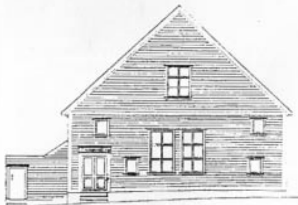
Fasade mot Klostergaten slik denne var tegnet av Reichborn i 1768 (til venstre), og slik den ser ut nå.