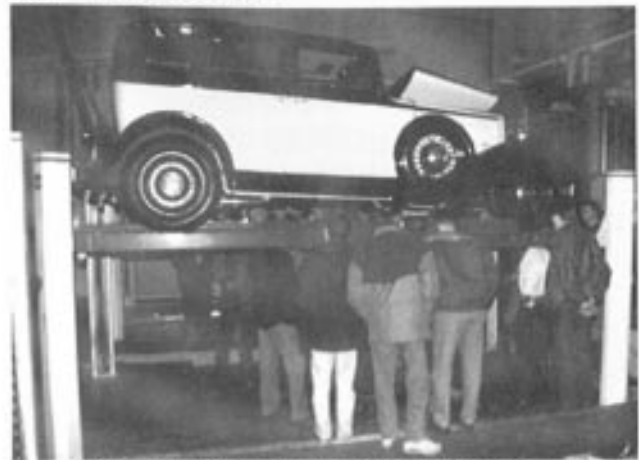
10. januar 1995 møtte 35 medlemmer fra Bergen Vognveteranklubb i kontrollhallen til Biltilsynet i Fyllingsdalen.