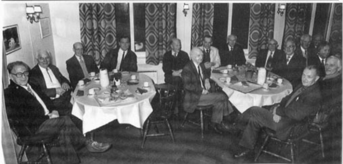
Fra et veteranreff hos Jæger 12. nov 1991