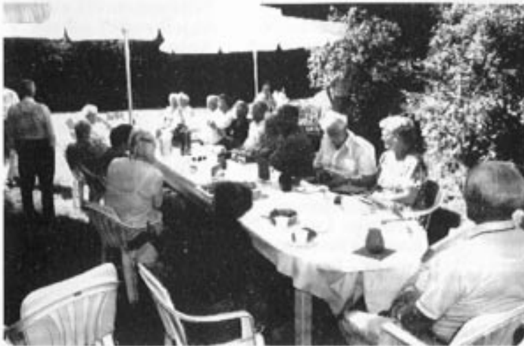
Ute på "øen i Sælenvannet" 27. juni. Sol, sommer, rømmegrøt og klippkringle.

Mange veteraner var aktive andre steder den 27. juni da blåturen startet fra Bystasjonen kl 1030. Bergensdalen lå badet i sol. I ferien var mange bortreist eller sammen med familien.