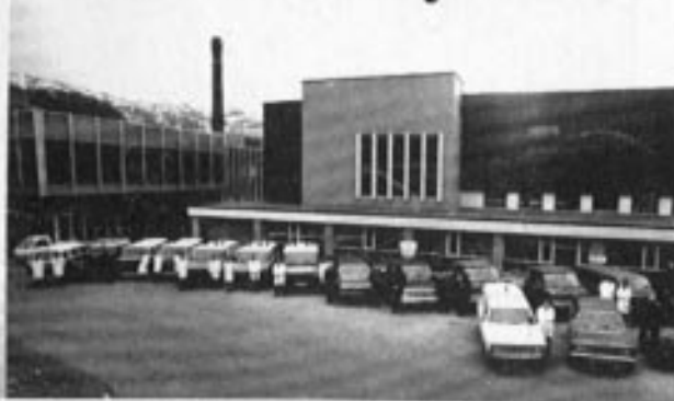
"Vårt medlem" av Bilbransjens veteraner i Bergen har ansvar for driften av kjøretøy ved Haukeland Sykehus. se side 4