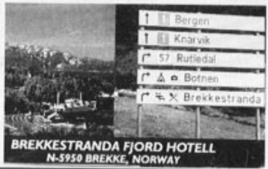
BREKKESTRANDA FJORD HOTELL N-5950 BREKKE, NORWAY