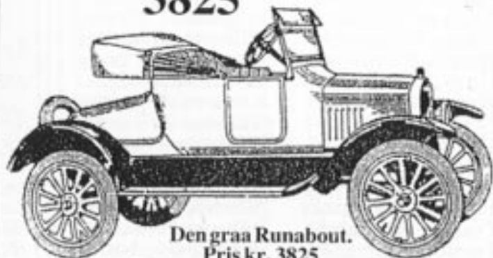
Den graa Runabout.