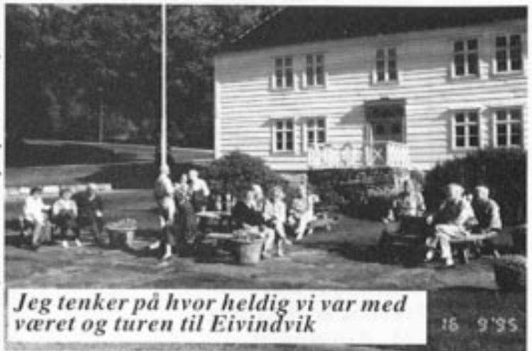
Jeg tenker på hvor heldig vi var med været og turen til Eivindvik