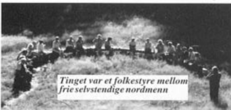
Tinget var et folkestyre mellom frie selvstendige nordmenn