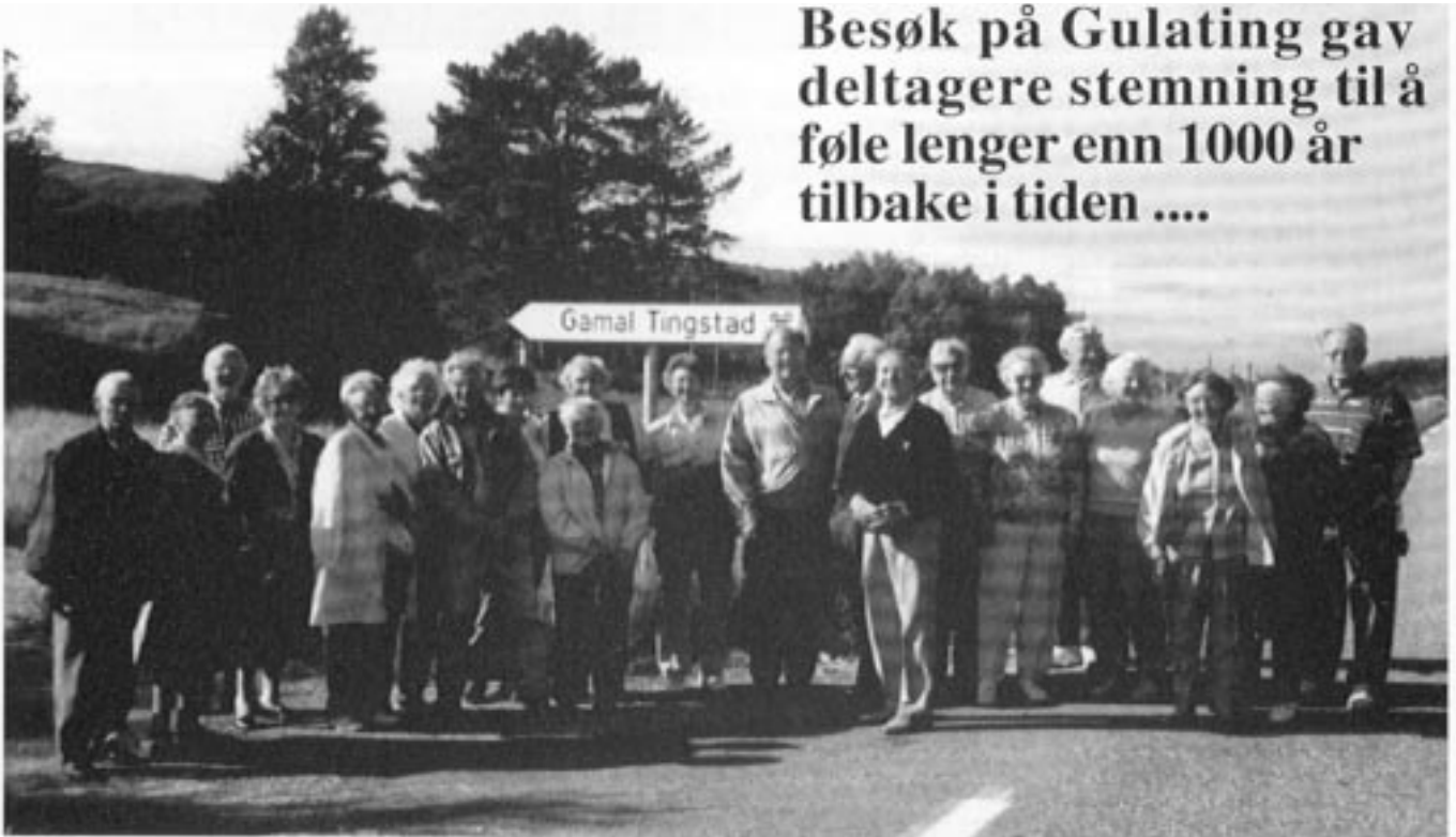
Bussen stoppet for Tingstaden nær Flolid i Gulen ca 2 km fra Eivindvik Sentrum