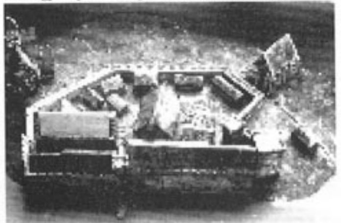
Modell av festningsområdet i målestokk