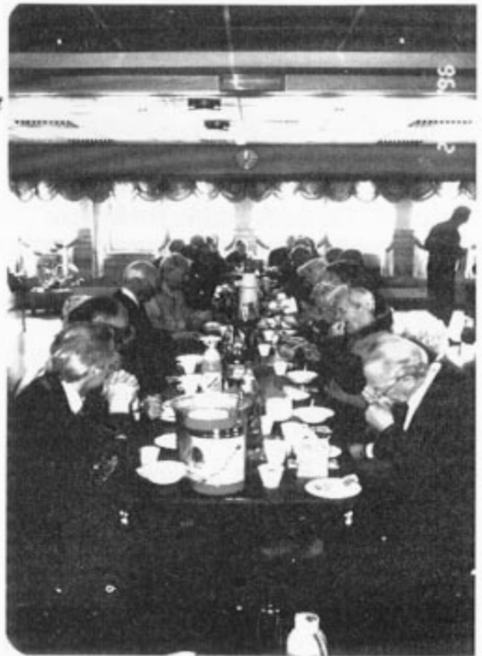
Kos med Mary's rømmegrøt.

Vi avsluttet med tur til Herdlevær der Håkon Håkonsen's armada i året 1262 reiste fra med 180 langskip og 18.000 mann på krigsoppdrag til Scotland. Kollsnes der gassen fra Troll-feltet ilandføres