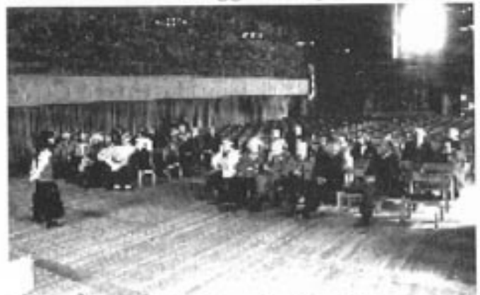
Benket inne i Håkonshallen der guiden redegjør for Bergenhus sin historie.