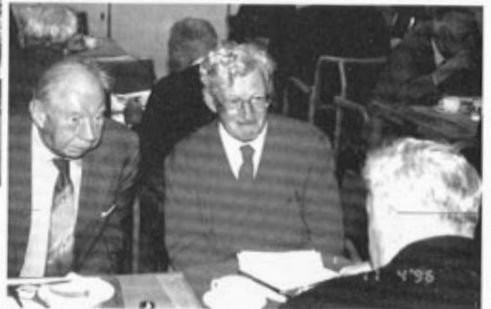
Etter maten er det kommentarene som skal fordøyes.