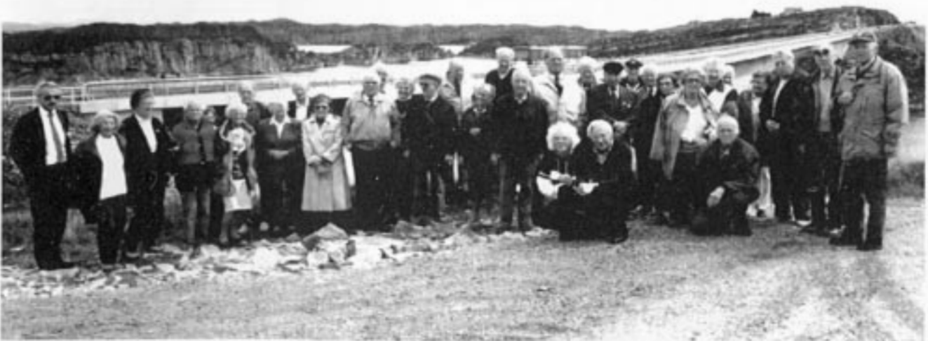
Fornøyde turdeltagere ute på Turøy poserer for fotografen.

og videresendes i rør til Europa og Norsk Hydro's anlegg på Sture. Her kommer oljen fra flere felt i Nordsjøen for å hentes ut med omlag 400 skip i løpet av et år.