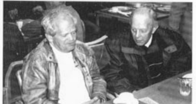
Begge var enig om at arrangementet var vellykket