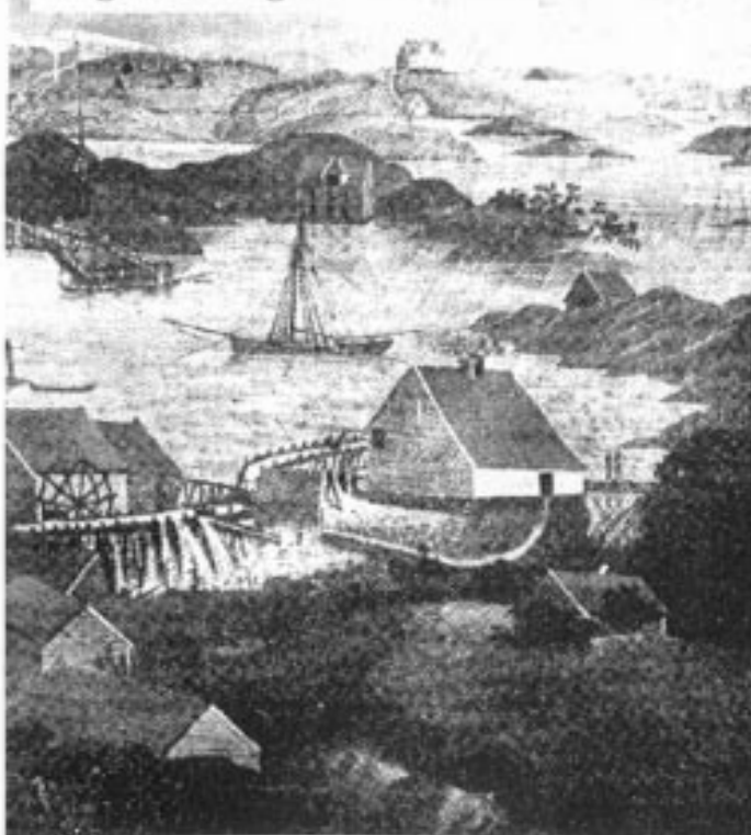
Maleri fra Alvøen i gamle dager:

I Alvøen parkerte bussen på tunet til fabrikken som startet i 1628. På forhand var delvis lovnad fra Dipl. ingeniør