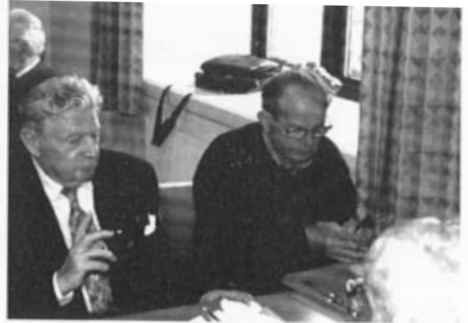
Diskusjon om mat i militæret før og nå