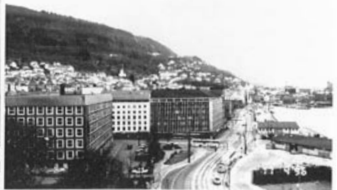
Det var ikke p.g.a utsikten at Rosenkrantzårnet ble reist.