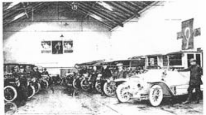
P.H.T. Schmidts Automobilavdeling før 1. verdenskrig.

Etter hvert ble arbeidene mer spesialisert, skillet mellom de enkelte arbeidsoperasjoner ble sterkere. Noen verksteder utviklet spesialkunnskap om enkelte bilmerker og ble "merkeverksteder" for Ford, Chevrolet eller andre. De sysselsatte på