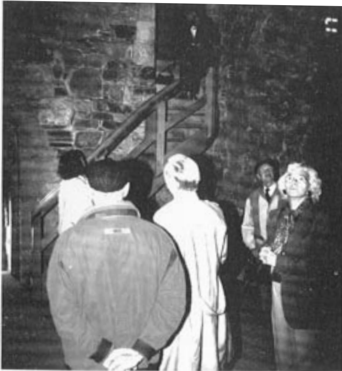
Kommentarer om byggekunsten fra dengang.