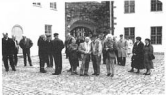
Bilveteraner i Borggården på Bergenhus.