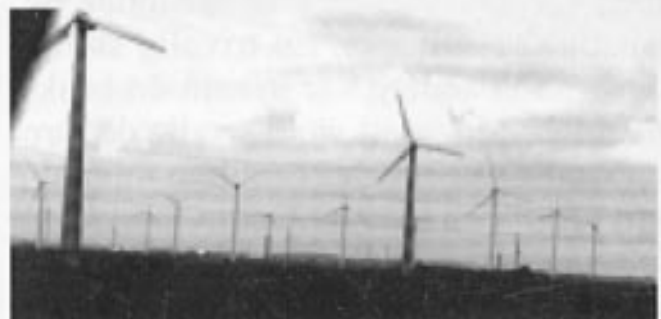
Norge's naboer i syd forstår å utnytte vinden for produksjon av el. kraft..