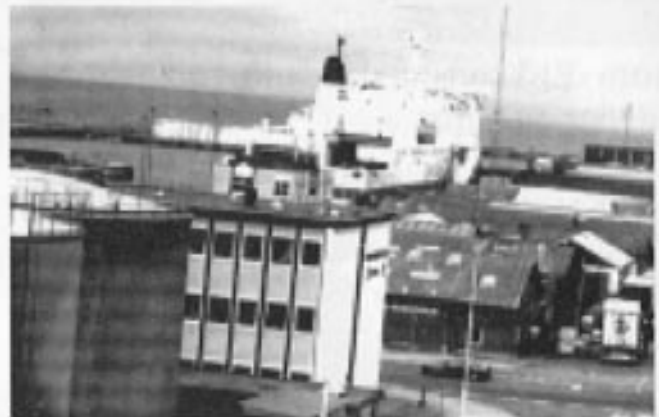
M/S BERGEN ventet på oss i Danmark