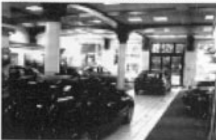
I dag for BMW - Rover