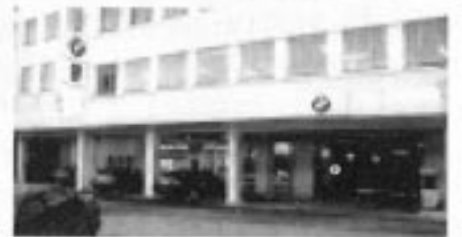
Under omvisningen merket vi oss at det var investert store summer til ombygging, bruksendring og ansiktsløfning.