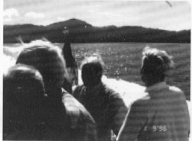
Stemningsbilde over Bjørnefjorden.

det fikk vi se, for trær og vekster var overalt. På smale veier kjørte Hustad HSD bussen med en sikkerhet som var utrolig, for vi følte vel alle at vi var kommet "på den smale sti".