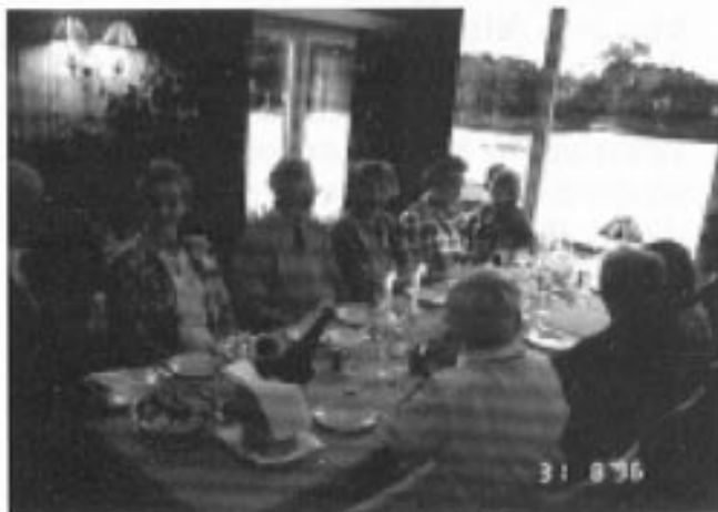
Fra skalldyrsaften lørdag.