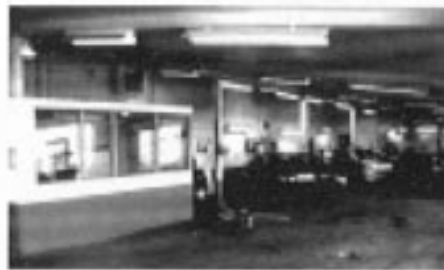
Arbeidsoperasjonene er sterkt endret fra tidligere tider..