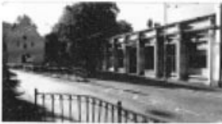
Jæger's lokaler fra 1928