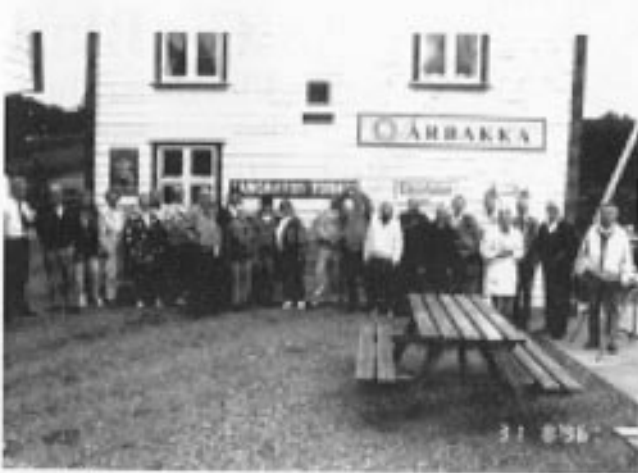
Årbakka var et fantastisk sted.

tom Reksteren der han fortalte om steder og natur.