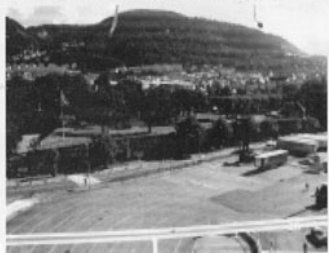
Alltid godt å komme hjem til Bergen.