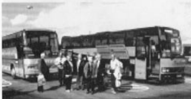
Hva med den norske tollene ?