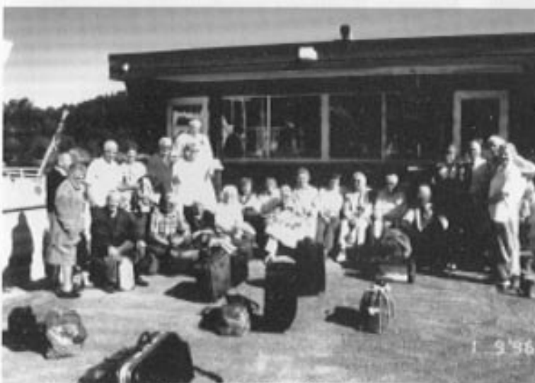
Før avreisen tok vertinnen seg god tid til å ta avskjed med oss..