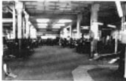
Gjensyn med et verksted i full drift,