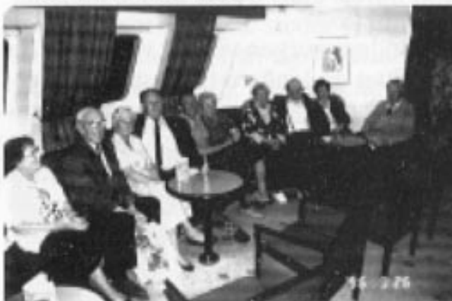
Koselig samvær i pianobaren.