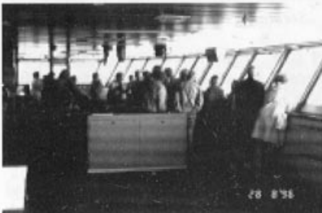
Det store overblikket.