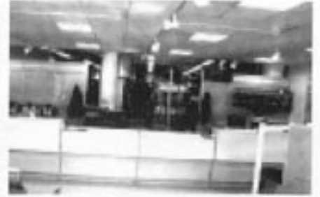
Ny moderne Autoshop for BWM og Rover