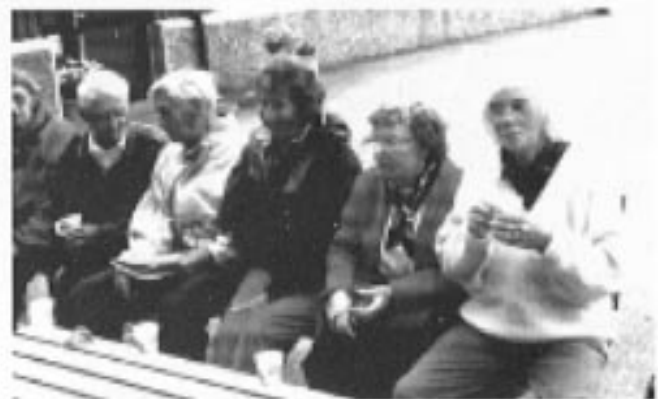
og kaker etter en fin rundtur..