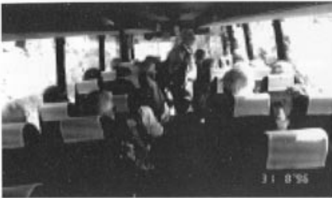
Klar for Tysnes rundt.

Ja atter en gang var arrangert en fin høsttur, med start ved jernbanestasjonen der en HSD buss ventet på oss.