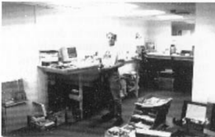
Stig, Teknisk sjef i ULTRA Tech AS, ser nye utfordringer med Kenya prosjektet.. Info Internett se: http://www.ultra.no

for eksempel i regnskap, etter manuelle metoder og bruk av papir og blyant, som også er utbredt i næringslivet. Universitet og skoler har enda bare begrenset adgang til å bruke PC. Sett med Norske øye er Kenya et stort marked med sine nærmere 30 millioner mennesker. Det er en mellomklasse av ca 5 millioner innbyggere og en overklasse på ca 1 million - i første omgang et marked på 6 millioner mennesker, altså større enn Norge. ULTRA