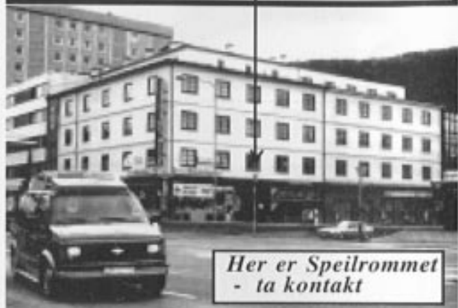
Her er Speilrommet - ta kontakt