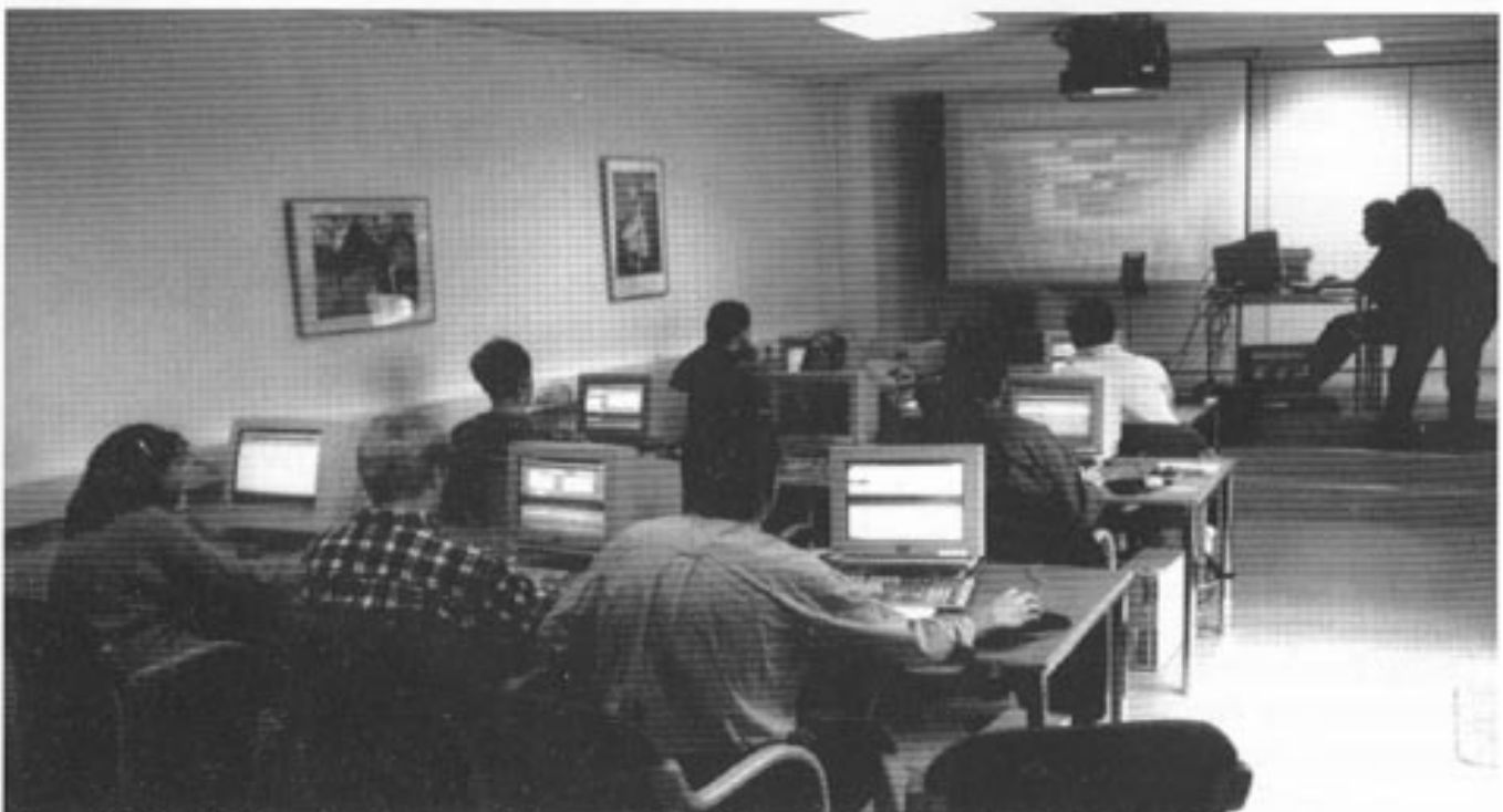
Norsk Bildelekatolog leverte i januar 1997 flere kurs for CD-ROM katalogen til ledere av verksteder i Bergen og Hordaland. Bildet fra et kurs hos Kvam Data i Norheimsund.

I 1996 investerte norske bildeleimportører 3.6 mil kr for tilpasning av CD katalogen til det norske marked. Verksteder forventer av det nye systemet øket effektivitet, hurtigere kundeservice, færre feilbestillinger, mer rasjonelt lagerhold og bedre driftsrutiner