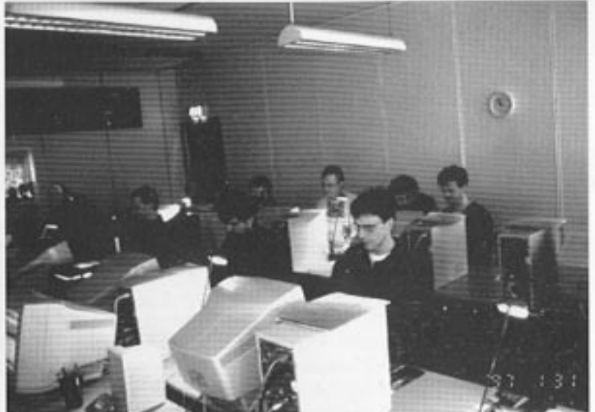
At det for kursene i januar hos Datakunnskap Opplæring AS var Norsk Bildelekatolog som stod for undervisningen - var ingen tilfeldighet.

Datakunnskap Opplæring AS startet virksomhet i august 1992. Målsetting var å skape et leverandør uavhengig opplærings-senter av høy kvalitet. Da Norsk Bildelekatolog i januar 1997 leverte 2 av sine kurs i Bergen var det i et opplærings-senter av høy kvalitet. Der arbeides bevisst for å skape et miljø som er godt for læring, både når det gjelder lokaler, utstyr