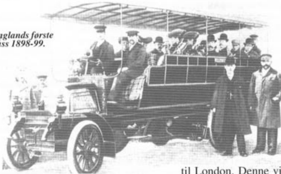
Englands første buss 1898-99.

Verdens første bussrute i 1895 (Siegen-Nethen-Deuz) var basert på en Benz Phaeton og det samme var også verdens andre bussrute i 1896 i Gudbrandsdalen her i Norge. Begge disse rutene var kortvarige, bl. a. på grunn av svake motorer og mange bakker. Utviklingen gikk videre - og i 1898 leverte Daimler en 20 seters buss med 12 hestekrefter