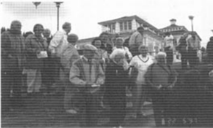
Veterankoret fra bilbransjen oppstilt med nydelig utsikt over byfjorden og store deler av Bergen by ... og så vellyd for øret