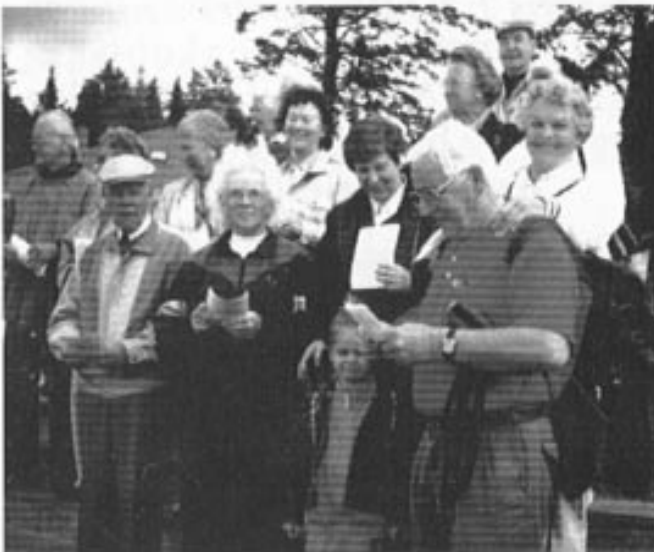
Bilbransjeveteraner sang på utsikten fra Fløyen. ....se side 8