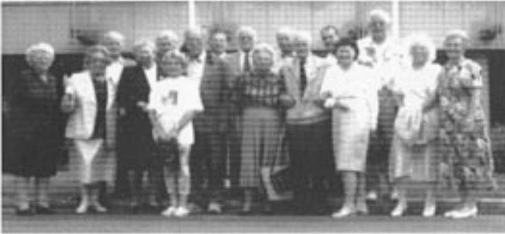
Var publikum for NRK1 23. sept. 1997 i TV program "Antikviteter og Snurperier"