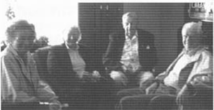
Trivsel er en dyrebar gave ...