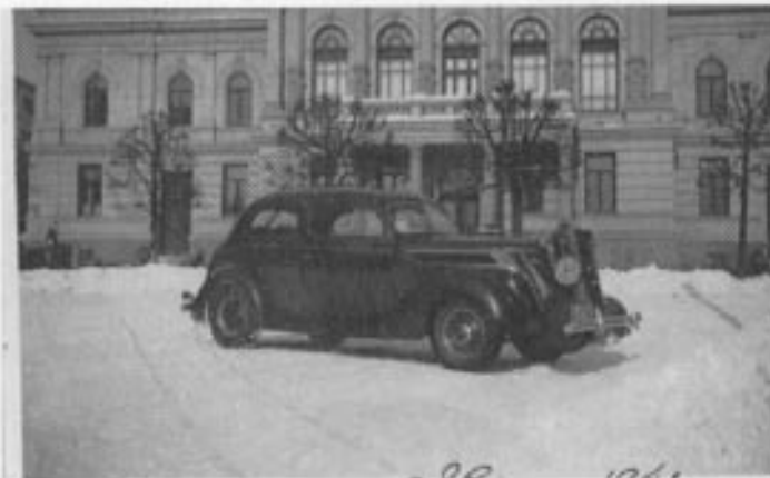
Karbidgeneratorer var et vanlig syn i gatebildet til lenge etter krigen.

Mathiesens Auto-Co A/S fremstilte og produserte etter egne patenter Cargas acetylgeneratorene (karbid) under og etter krigen.