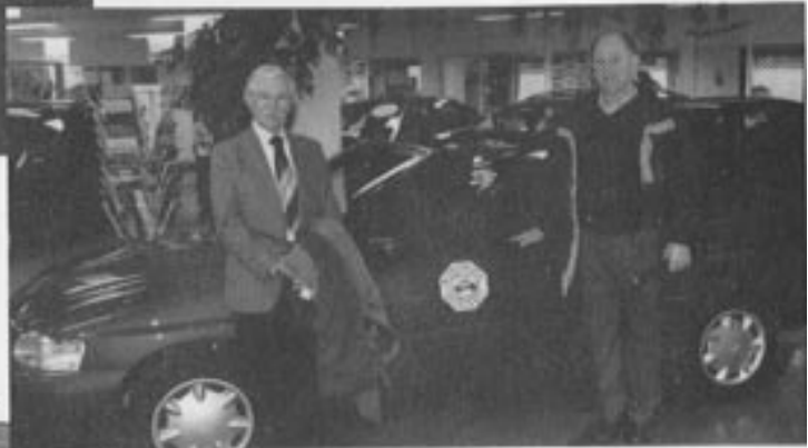
Til venstre: I dag fremstår lokalene som meget formålstjenlig og moderne: